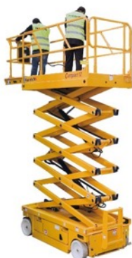
Nacelle ciseau 12 mètres