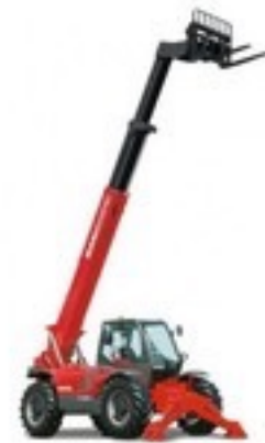
Manipulateurs télescopiques fixes 17 m