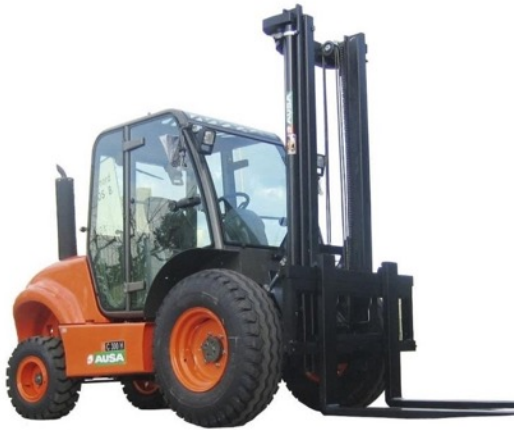
Chariots élévateurs tout-terrain