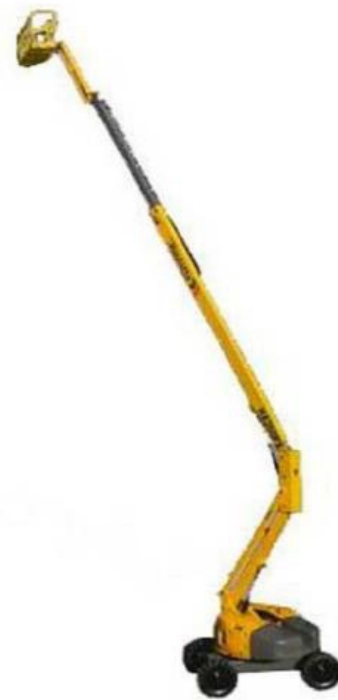
Supérieur à 42 mètres