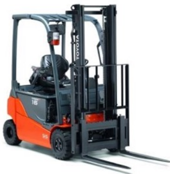
Chariots frontaux électriques