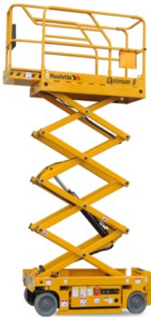
Nacelle ciseau 8 mètres