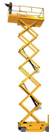
Nacelle ciseau 14 mètres