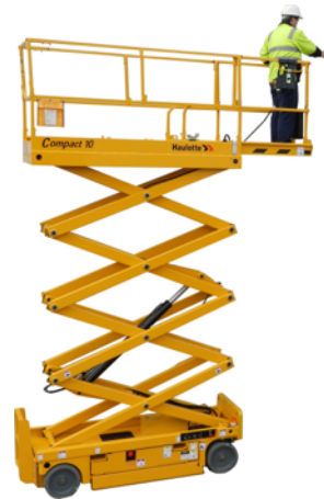
Nacelle ciseau 10 mètres