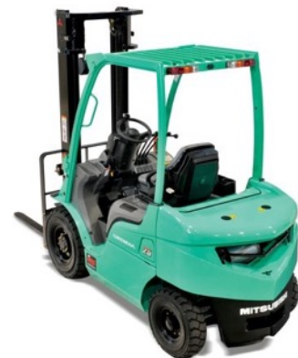
Chariots frontaux diesel